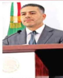
Harfuch encabezó la conferencia del Gabinete de Seguridad

El Gabinete de Seguridad cuenta con información de que existía un riesgo de que algunos de estos objetivos solicitados por el gobierno de Estados Unidos fueran liberados.