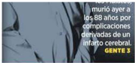
Los funcionarios murieron ayer a los 88 años por complicaciones derivadas de un infarto cerebral.