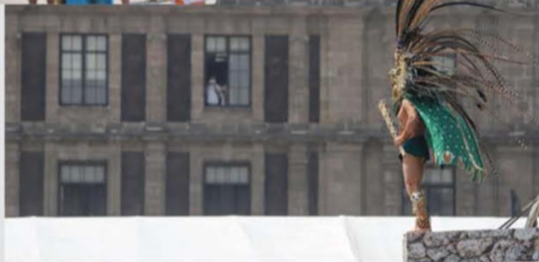
A 500 años de la muerte de Cuauhtémoc, el último rey Tlatoani del Imperio Mexica, en el corazón de la Ciudad de México se llevó a cabo un homenaje solemne encabezado por la presidenta Claudia Sheinbaum Pardo. PAG. 7