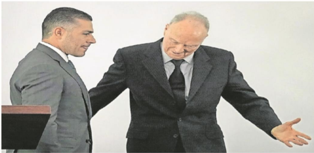
El secretario de Seguridad y Protección Ciudadana, Omar García Harfuch, y el fiscal General de la República, Alejandro Gertz Manero, durante la conferencia de prensa en la que dieron pormenores del traslado de 29 capos mexicanos a Estados Unidos realizado el 27 de febrero.