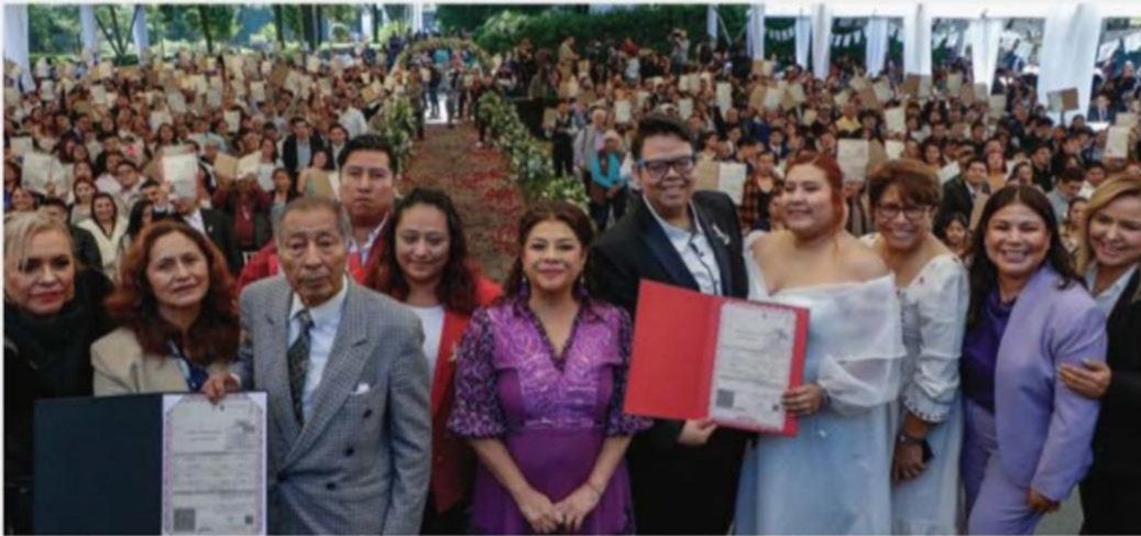
El Día del Amor y la Amistad fue celebrado de manera especial en el Complejo Cultural Los Pinos, donde se llevó a cabo la boda colectiva "Amor es Amor", que reunió a más de 500 parejas de diferentes edades y trayectorias. PAG. 9