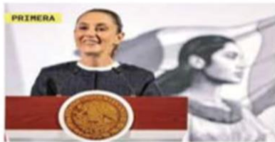
SHEINBAUM: MÉXICO ESTÁ DE MODA

información faltante. Sin embargo, dijo que el Senado ayudará al INE en lo que pueda. PRIMERA | PÁGINA 4